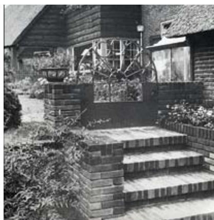
Aanzicht trap, hek terras en tuin (J.H. Bitters)

Bloemenwandeling Een plant had in de ogen van Tine Cool één taak in de tuin en dat is bloeien. Iedere tuin hoorde een 'bloemenwandeling' te hebben, waartoe ook de appelbloesem in het voorjaar en de vallende kastanjes in het najaar werden gerekend. In alle tuinen die zij ontwierp kwam een uitbundig bloeiende border die voor, een border die zo lang mogelijk moest boeien. Ze verdiepte zich in het karakter van een plant om de eigenschappen van die plant optimaal te kunnen benutten. Ze zocht naar wat ze zelf plantengemeenschappen noemde: geen losstaande vegetatie wilde ze, maar een samenhangend geheel van het vroege voorjaar tot laat in de herfst, liefst ook nog groenblijvend en bloeiend in de winter als Mahonia of Helleborus niger .